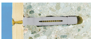
Rozepření v plných materiálech